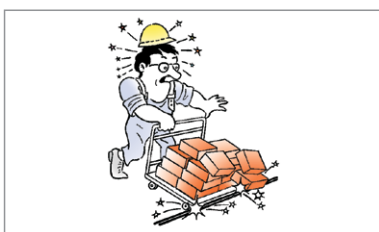
Przewód bez osłony